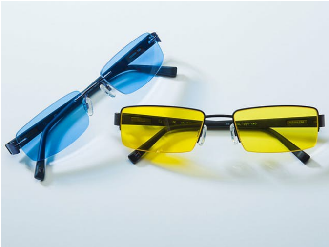
Teintes de mode de la catégorie Filtre 1 (20 – 57%), Space Blue et Happy Yellow.